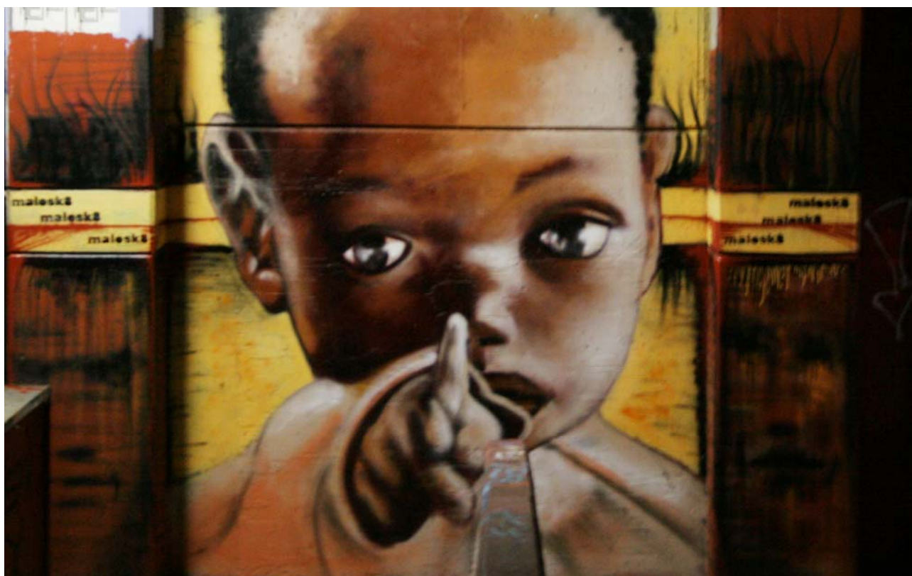
Soggetto murale realizzato di recente

Autorizzo il trattamento dei dati personali contenuti nel mio curriculum vitae in base art. 13 del D. Lgs. 196/2003.