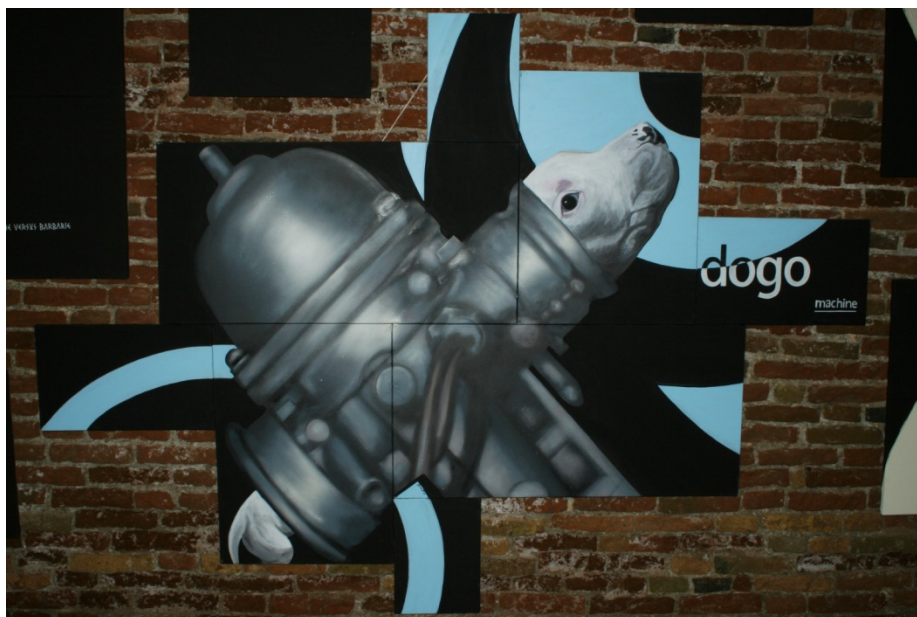
Soggetto per la mostra Head Lines di Venezia